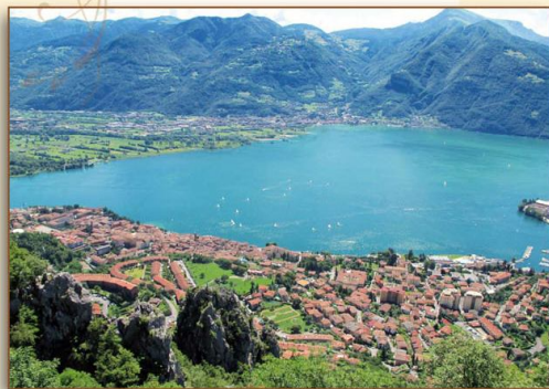
Lovere da S. Giovanni